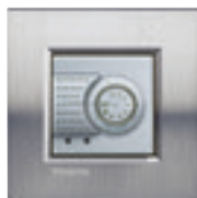
NT4692 + plaque Acier Brossé LNA4802ACS