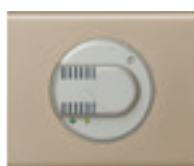
0 674 58 + enjoliveur + plaque Nickel Velours 0 691 11