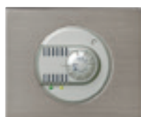
0 674 57 + enjoliveur + plaque Inox Brossé 0 691 01