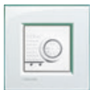
N4692 + plaque Aigue Marine LNA4802KA