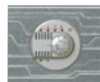
0 674 55 + enjoliveur + plaque Furtif 0 690 41