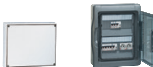
0 391 42