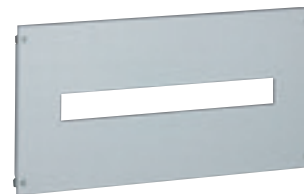
0 209 10