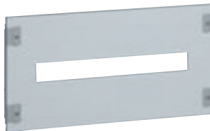
0 208 10