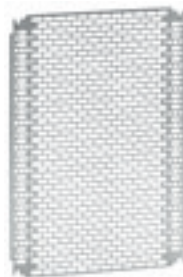
0 360 18