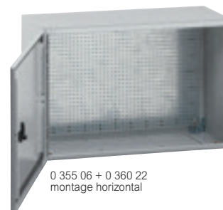
0 355 06 + 0 360 22 montage horizontal

Caractéristiques techniques p. 181 Visserie et fixation d'appareillage p. 214, 217