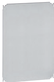
0 360 58