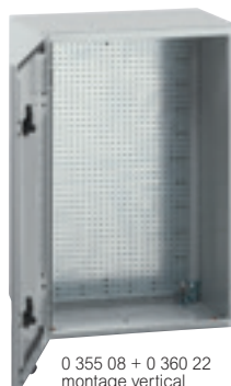
0 355 08 + 0 360 22 montage vertical