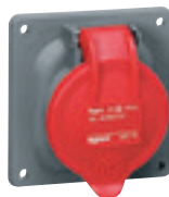
0 522 19