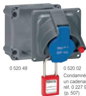
0 520 49 0 520 02 Condamné par un cadenas réf. 0 227 97 (p. 507)