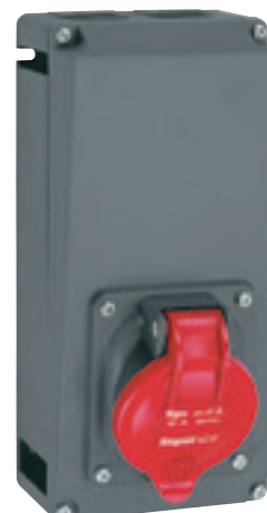
0 522 23 + 0 522 89

Tableau de choix p. 98-99 Caractéristiques techniques p. 114