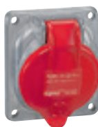
0 522 33