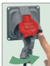
Appuyer sur le bouton pour la déconnexion

Tableau de choix p. 98-99 Pouvoirs de coupure p. 113