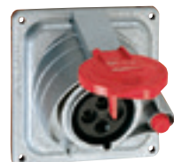
0 522 13