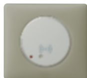
0 675 08 + enjoliveur + plaque Argile 0 667 11