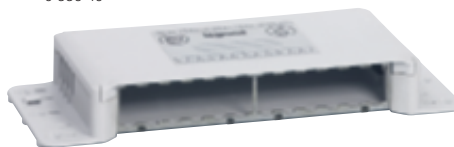
0 335 40