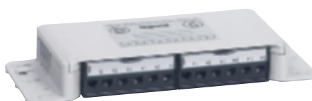
0 335 49