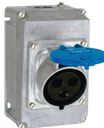
0 527 32 + 0 529 39