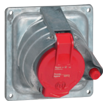
0 529 13