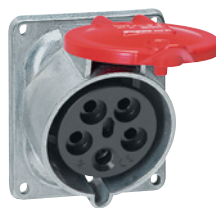
0 529 34

Tableau de choix p. 496-497 Caractéristiques techniques p. 512