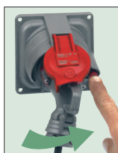
Appuyer sur le bouton pour la déconnexion

Tableau de choix p. 496-497 Pouvoirs de coupure p. 511