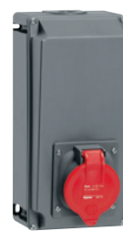
0 529 19 + 0 529 90