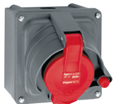
0 529 04 + 0 529 49