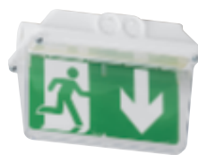
0 626 76 + 0 625 26