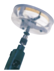
0 625 97

pour ERP, locaux industriels et bâtiments d'habitation