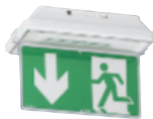
0 626 75 + 0 625 25