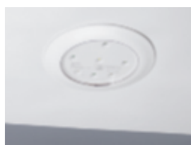
0 625 64 (monté)