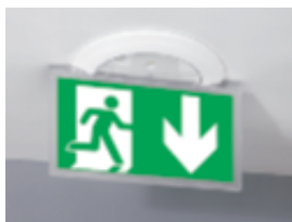
0 625 24 (monté)