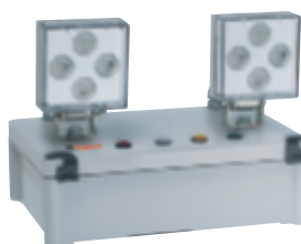
0 625 32